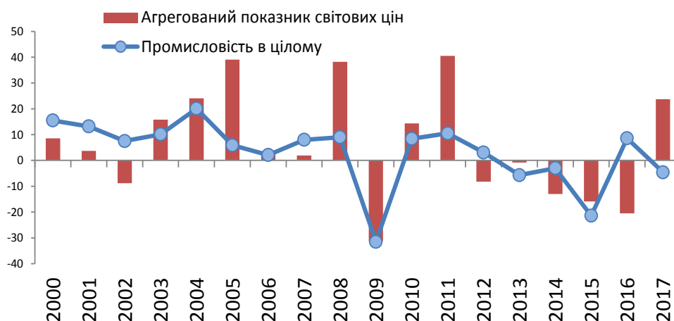
Рис. 1. Промисловість України та АПСЦ у лютому, %, р/р

«зростання світових цін на зовнішніх ринках не компенсувало погіршення ситуації в промисловості в умовах дестабілізації на сході країни»