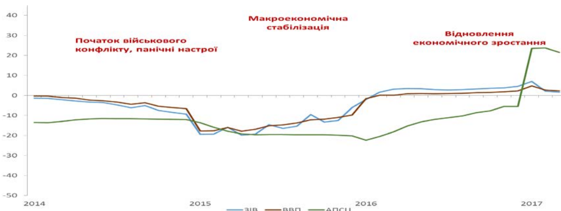
Рис. 1. Динаміка ЗІВ, ВВП та АПСЦ, % до відповідного періоду попереднього року

АПСЦ – агрегований показник світових цін, що враховує динаміку світових цін на соняшникову олію, кукурудзу, пшеницю, мочевину, залізну руду та чорні метали.